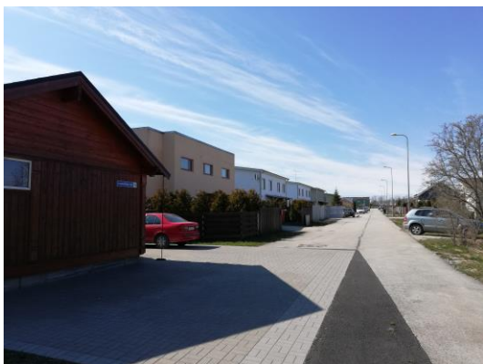
Roosipõõsa tee äärsed elamud

Kontaktvööndi hoonestus on erilmeline, kuid valdavalt viilkatustega ühepereelamud.