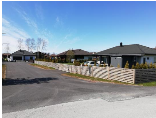
Jaanivälja põigu elamud