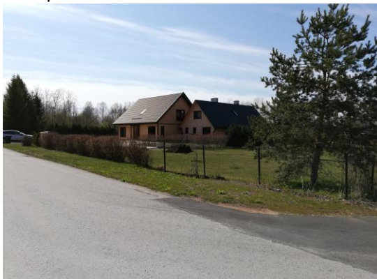
Jaanivälja tee 1a elamu