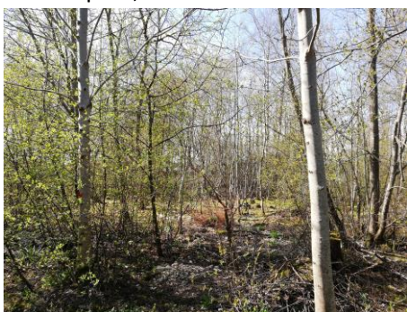
Foto 5 Vaade kinnistul kasvavatele puudele

Detailplaneeringu ala moodustatud teemaa ja elamumaade hoonetus aladele on teostatud Arbomare OÜ poolt „Jaanisalu kinnistu osaline haljastuse hinnang“, mille tulemusel antud alal kasvab põhiliselt harilik toomingas, hall lepp, harilik pihlakas, harilik saar, kask ning harilik haab. Ühtegi väga väärtuslikku ja kindlasti säilitamist väärt puud hinnatud puude seast ei leitud. Metsale iseloomulikult on Jaanisalu kinnistul kuivanud, ümber kukkunud, murdunud puud ja võsa. Kõige jämedam puu on 29cm läbimõõduga kuldkaask. Enamus puud on 10 - 20cm läbimõõduga noored puud. Säilitada tasub noori terveid puud, millel on olnud ruumi kasvada ühtlase võraga sirgeks puuks.