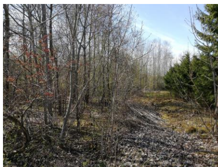
Foto 6 Vaade kinnistu põhjapiirile.

Teedest ja hoonestusalast väljaspool olev kõrghaljastus on soovitatav maksimaalselt säilitada. Kuna teemaa ja kruntidele sissesõidutee, parkla osas teostatakse lageraiet, siis antud alas on III väärtusklassi puud vaid 16 tükki ja need on 2 kuldkaske, 1 harilik vaher, 7 harilikku saart, 6 harilikku toomingat. Elamumaa kruntide hoonestusala piires likvideeritavad puud määratakse hoone projekti käigus. Puude likvideerimisel tuleks teostada asendusistutus, võttes arvesse maaüksuse haljastuslike kui ökoloogilisi aspekte.