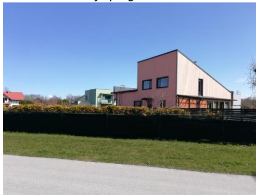
Lepiku tee 11a elamu